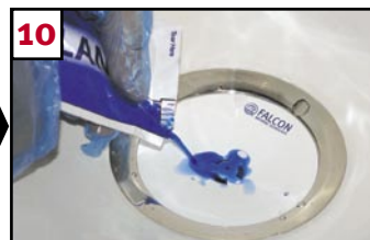
10 Add blue sealant (allow time to drain into cartridge)