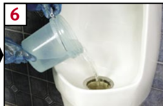
6 Flush housing with warm soapy water