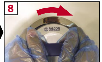
8 Insert new cartridge into housing and turn key to right to lock