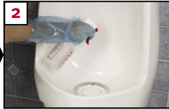
2 Spray (mist) Falcon-recommended* cleaner onto bowl