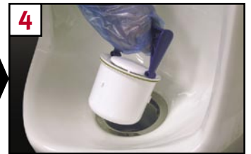
4 Lift cartridge and drain all free liquids