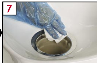
7 Wipe clean inner stainless steel rim