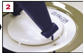
2 Insert key into cartridge