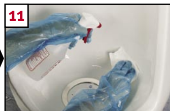
11 Spray (mist) Falcon-recommended* cleaner and wipe clean