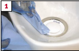
1 Remove debris from bowl