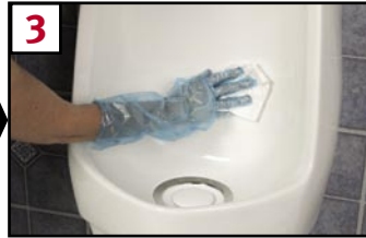
3 Wipe clean and dry