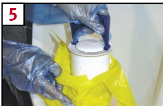
5 Place cartridge into disposal bag and dispose