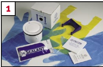
1 Verify contents of kit