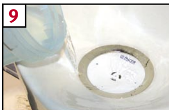
9 With diverter shield removed, fill cartridge with 1 quart or more of water until there are no air bubbles