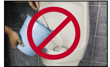
Never dump cleaning solutions or other chemicals into bowl