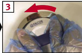
3 Turn key to left to unlock